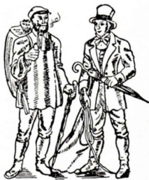
Westfaalse stoffenhandelaars, links in 18e eeuw, rechts in 19e eeuw.

Ruim voor 1800 is er uit Berge een trek op Zijpe ontstaan van handelaren in stoffen (lappiespoepen). 'Drie keer per jaar gingen ze naar huis in Westfalen, naar vrouw en familie en om hun voorraden aan te vullen: met Pasen, in augustus en met Kerstmis. Uit Berge waren ze afkomstig, op 60 kilometer van de grens bij het Twentse Denekamp. Het waren veelal lutheranen, die in het katholieke Westfalen achtergesteld werden. Het waren keuterboertjes/pachters en landarbeiders met een grote moestuin. Wollaken verkochten ze vooral in de Noordkop: een weefsel van niet ontvette schapenwol en linnen, nogal waterafstotend. Dat werd in Westfalen 's winters door thuiswevers gemaakt. Ook gebreide producten, zoals kousen, kwamen daar vandaan. Op 30 januari 1800 kochten de zwagers Hermann Gerhard Norp en Johann Bernd Meijer, respectievelijk 33 en 40 jaar oud, het voorhuis van een pand aan de Grootte Sloot oostzijde, richting Burgerbrug in St. Maartensbrug. Ze hadden al jaren als lappiespoep door de Zijpe en omgeving een klantenkring opgebouwd. Ze waren hier toen in de kost en bezochten lopende met de zogenoemde poepezak 2 à 3 keer per jaar hun klanten in de Zijpe en ruime omgeving.' (citaat venster 22 van het Zijper museum).